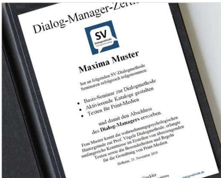
Ihr "Dialog-Manager,, Zertifikat

- „Texten für Print-Medien“ - „Bessere E-Mails und Newsletter schreiben“ - „Kreatives Schreiben“