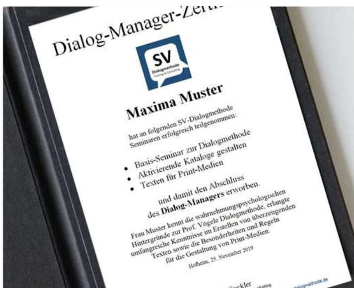
Ihr "Dialog-Manager,, Zertifikat

- „Texten für Print-Medien“ - „Bessere E-Mails und Newsletter schreiben“ - „Kreatives Schreiben“